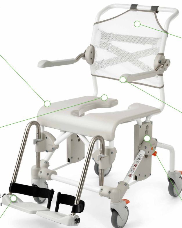
Swift Mobil -2, standard model

Let at justere til forskellige sædehøjder uden brug af værktøj.