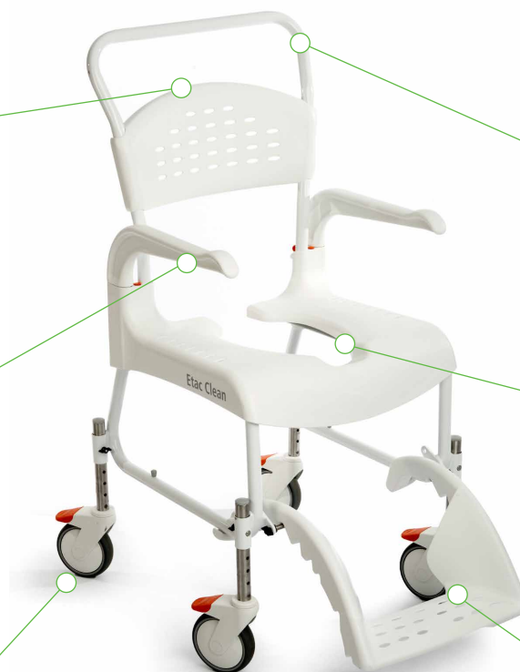
Clean, højdejusterbar model

Unik fodstøtte, der foldes ind under stolen, når den ikke er i brug. Buet fodplade for komfort og afslapning.