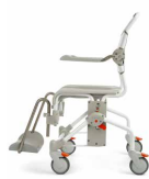
Med Opret ryg