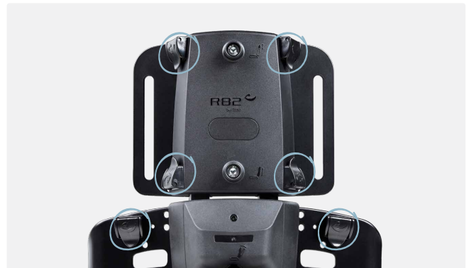
Fix locks ved nedre og øvre ryg til montering af vest.