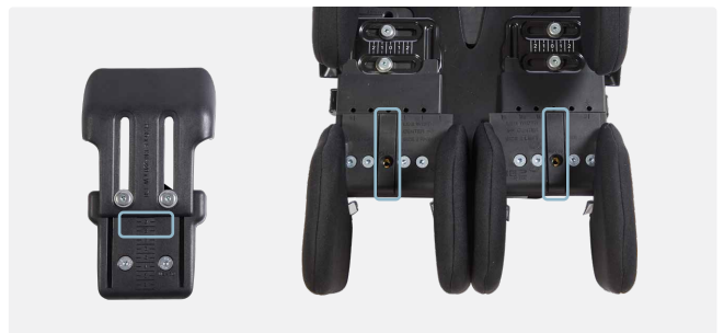
Placering af kilen og monterings sæt til kiler.