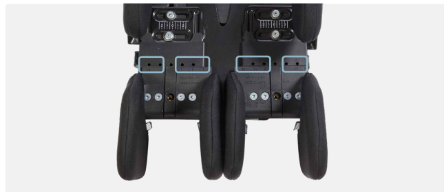
Placering af de indvendige og udvendige knæstøtter.