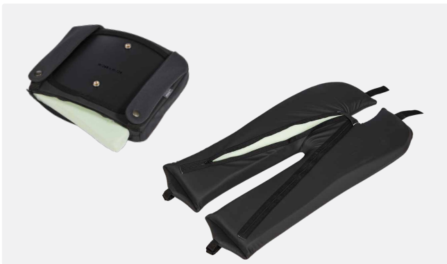
Betræk og skum til øvre rygpude og sædehynde.

Ved rengøring under sædepuden kan det være nødvendigt at løsne eller fjerne noget af tilbehøret. Ikke alle sæder har samme tilbehør, og der kan være dele, der kan springes over. Det anbefales ikke at vaske skumdele.