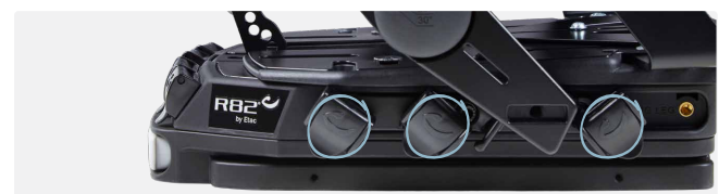
Fix locks ved sædets base til montering af sele.