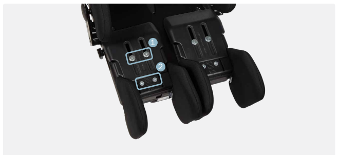
Løsn (1) eller afmonter (2) kilen.