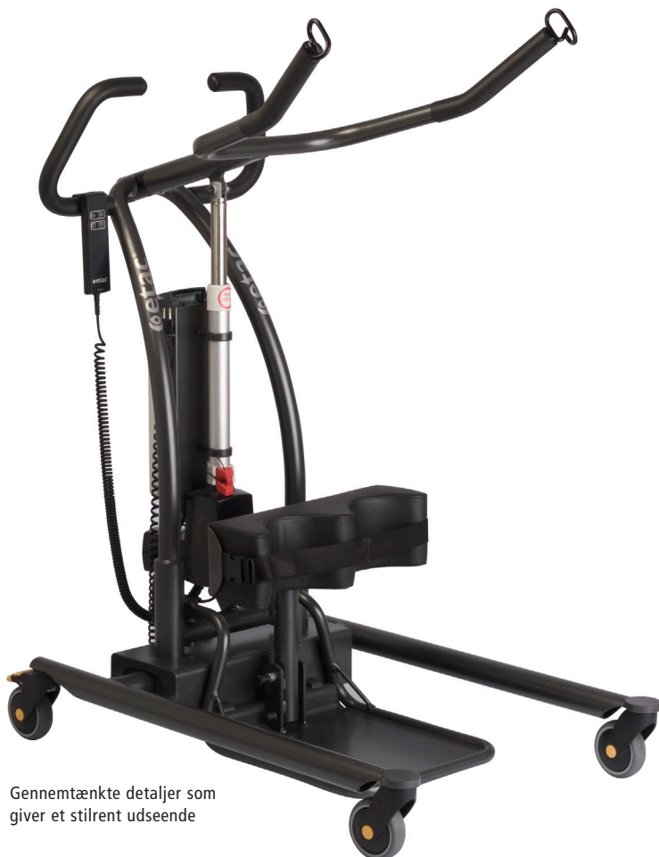
Gennemtænkte detaljer som giver et stilrent udseende

Ståløfterens forskellige funktioner styres enkelt via håndbetjeningen. Understellet er elektrisk regulerbart i bredden. Hjullene ruller let ved forflytning og er låsbare. Takket være løftearmens store bevægelsesområde kan løfteren anvendes til både børn og voksne.