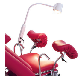
Undersøkelseslampe kan monteres direkte på benken.