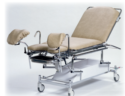
Vår kombigyn kan også brukes som vanlig behandlingsbenk. Benstøtter og pasienthåndtak er avtagbare.