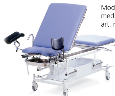
Modell SJ016-2050 med pasienthåndtak art. nr. SJ 010-2033