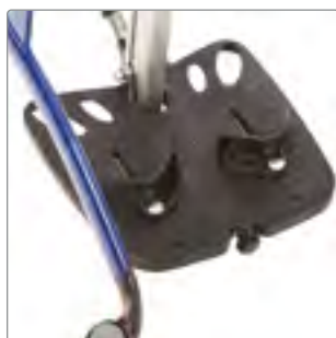
Hälstöd till fotplatta