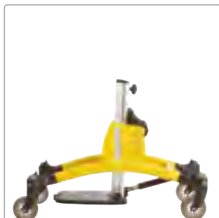
Storlek 1: Gul