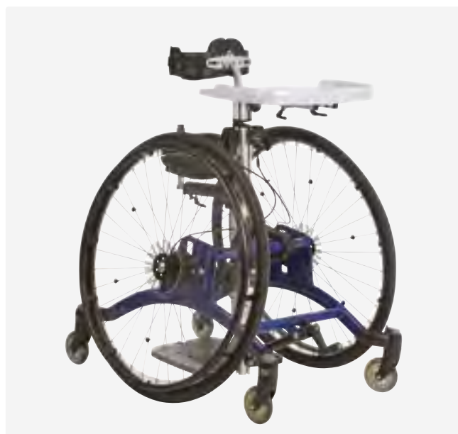
2 drivhjul, 4 länkhjul med eller utan broms.