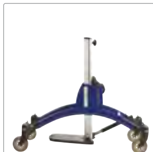
Storlek 2: Blå