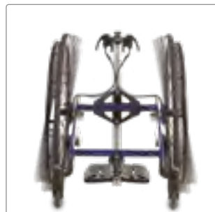
Standard cambervinkel: Storlek 1: 8°, Storlek 2+3: 6°, Size 4: 4° Camberkit (tillbehör) för cambervinkel +3°, +6°, -3°, -6°