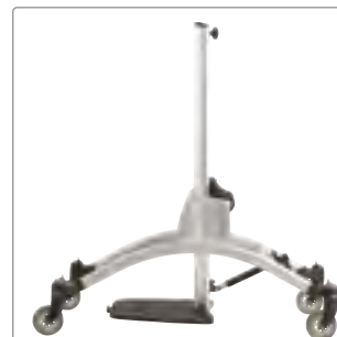
Storlek 4: Silver