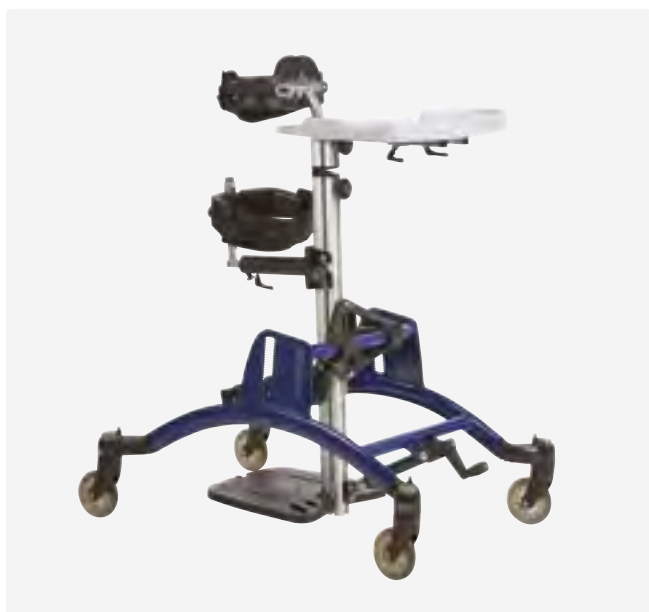
Utan drivhjul, med 4 länkhjul med broms och förberedd för drivhjul.