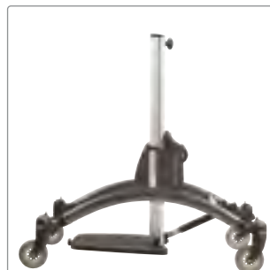
Storlek 3: Grå