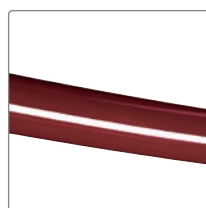
Storlek 3 = röd