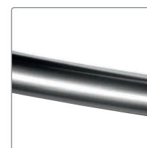
Storlek 4 = grå