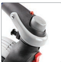
Hjulbroms på alla 4 hjulen