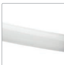
Storlek 2 = vit