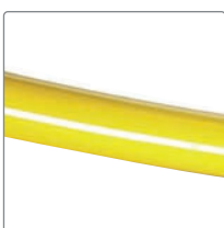
Storlek 1 - gul