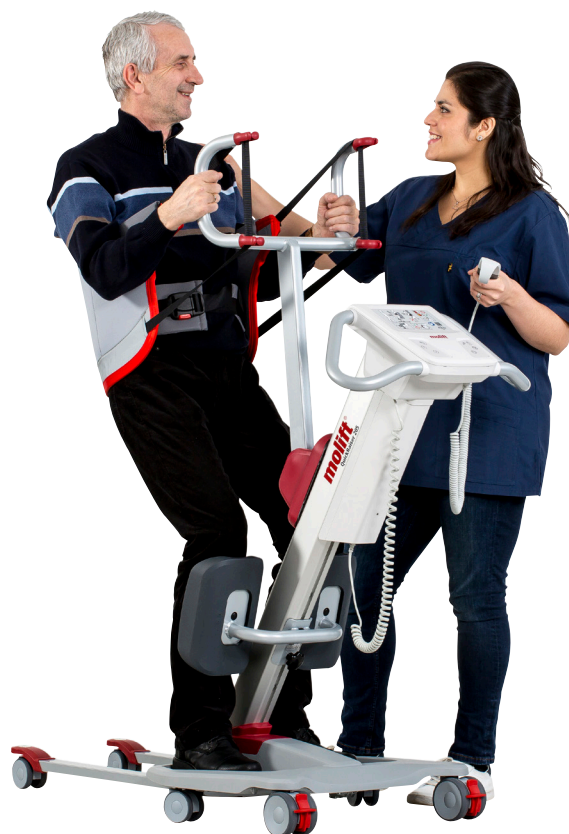
Active løftearm og RgoSling Active seil.

Enkel å manøvrere ved forflytnings- og oppreisingssituasjoner, toalett, sitte-til-stå og oppreisingstrening.