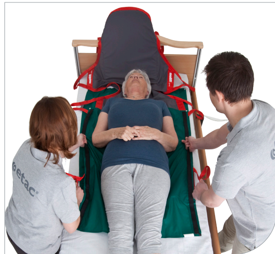
Applicera Molift RgoSling Fabric Stretcher med SlingOn under brukaren i liggande läge.

Vid lyft med Molift RgoSling Fabric Stretcher krävs det en 8-punkts lyftbygel. Molifts 8-punkts lyftbygel passar till mobila personlyften Molift Partner 255 och till lyftmotor Molift Air. Molift RgoSling Fabric Stretch har integrerade lyftremmar som appliceras direkt på lyftbygeln, längden kan justeras genom att det finns flera infästningsöglor att välja på. De många infästningspunkterna ger ett öppet och stabilt lyft i plant läge.