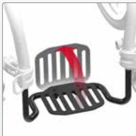
Voetenplaat In hoek verstelbaar en opklapbaar