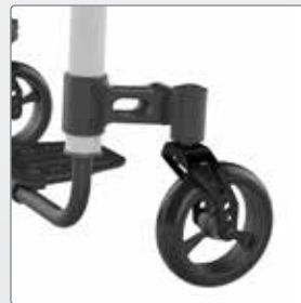
Design voorvork Gefreesd uit massief aluminium