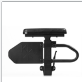
Armleuning In hoogte verstelbaar, met polstering