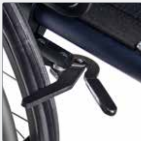
Schaarremmen Wegdraaiend onder de zitting