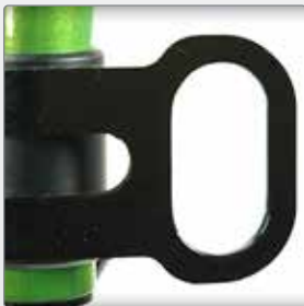
Transportbevestiging Goedgekeurd voor transport ISO 7176-19