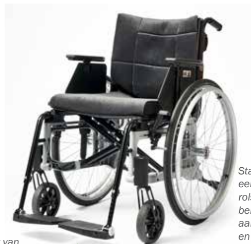
Etac Cross 6

Kortom, de Prio 3A gaat uit van de mogelijkheden van de gebruiker.