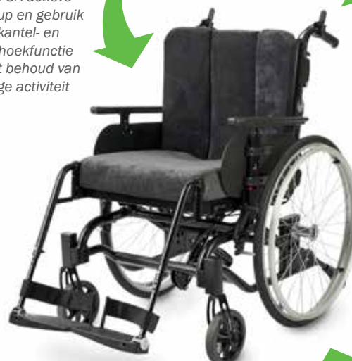
Etac Prio 3A (active instelling)

Stap over van een semi-actieve rolstoel naar een Prio 3A actieve setup en gebruik de kantel- en rughoekfunctie met behoud van enige activiteit