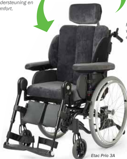
Etac Prio 3A (comfort setup)

Verlaat de actieve setup van de Prio 3A voor nog meer ondersteuning en comfort.