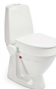
My-Loo 10 cm