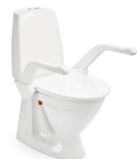
My-Loo con braccioli 2 cm

Le superfici lisce sono facili da pulire con un panno morbido. Qualora fosse necessaria una pulizia più accurata, è facile rimuovere e altrettanto semplice riposizionare il sedile e i braccioli.