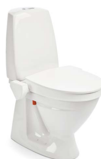
My-Loo 6 cm