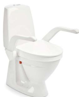
My-Loo con braccioli 6 cm