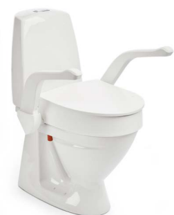
My-Loo con braccioli 10 cm