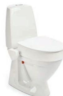
My-Loo 10 cm