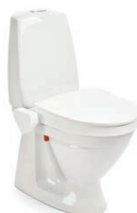
My-Loo 6 cm