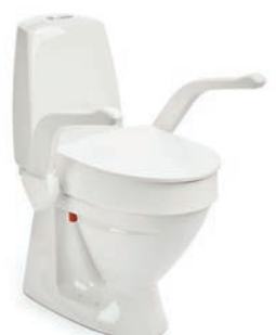
My-Loo med armstöd 10 cm