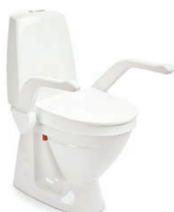
My-Loo med armstöd 6 cm