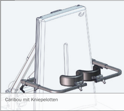
Caribou mit Kniepelotten