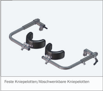
Feste Kniepelotten/Abschwenkbare Kniepelotten