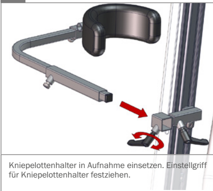
Kniepelottenhalter in Aufnahme einsetzen. Einstellgriff für Kniepelottenhalter festziehen.