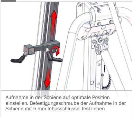
Aufnahme in der Schiene auf optimale Position einstellen. Befestigungsschraube der Aufnahme in der Schiene mit 5 mm Inbusschlüssel festziehen.