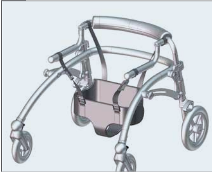
Crocodile mit Sitzhose für Größen 1-2