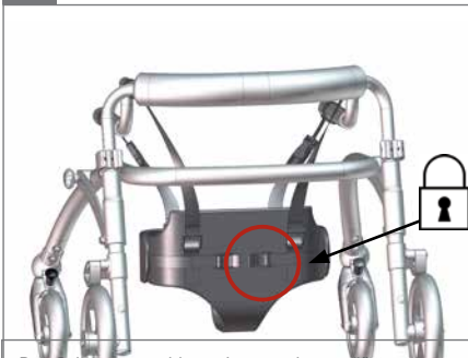
Den Schnappverschluss einrasten lassen/lösen, um ihn für den Benutzer vorzubereiten. Lösen, bevor ein Benutzer hineingesetzt wird.