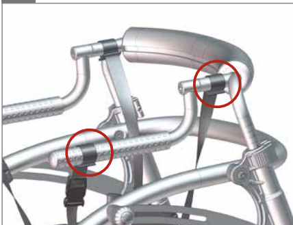
Die Sitzhose mit dem Klettverschluss an den Bändern am Rahmen befestigen