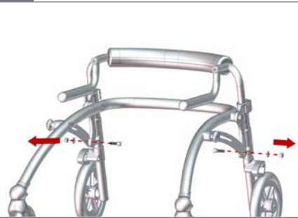
Schrauben, Muttern und Abstandhalter mit einem 13-mm-Schraubenschlüssel und einem 6-mm-Inbusschlüssel ausbauen und für Bild 5 aufheben