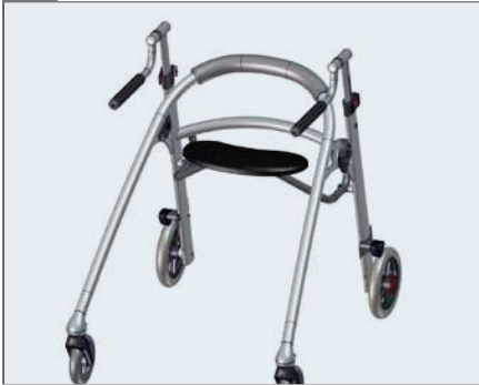
Das Crocodile Größe 3 mit montiertem Sitz