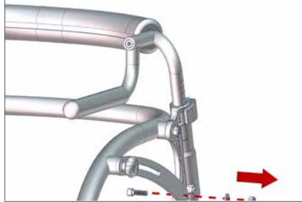
Schrauben, Muttern und Abstandhalter mit einem 13-mm-Schraubenschlüssel und einem 6-mm-Inbusschlüssel ausbauen und für Bild 5 aufheben