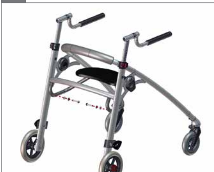
Den Sitz in den Rahmen einsetzen