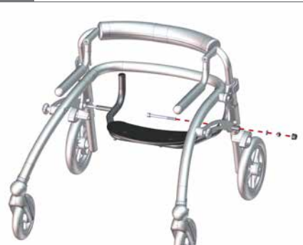
Den Sitz in den Rahmen einsetzen