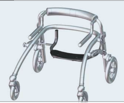
Das Crocodile Größen 1-2 mit montiertem Sitz