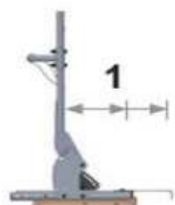
Position avant maximale