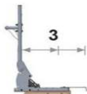
Deux trous vers l'arrière