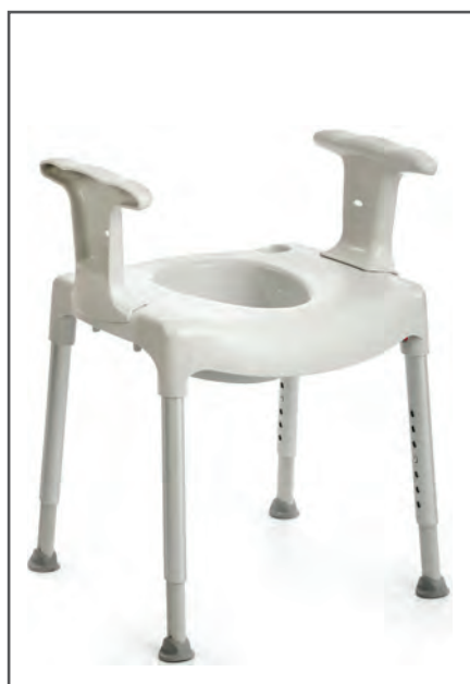
Swift Fristående Toalettstol