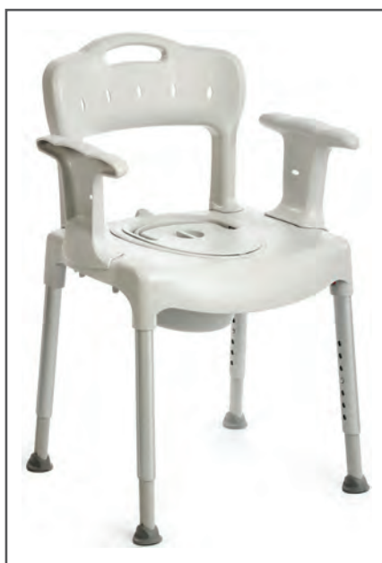
Swift Kommod basic