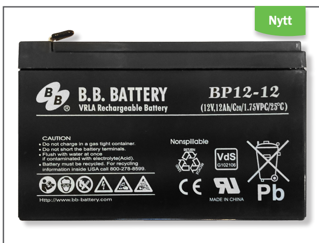
Nytt batteri till Lille Viking Batteri BP12-12 ersätter Batteri 12V/12A.

Vi kommer successivt att införa ett nytt batteri till Lille Viking då den nuvarande tillverkaren har slutat tillverka den modell som är till Lille Viking.