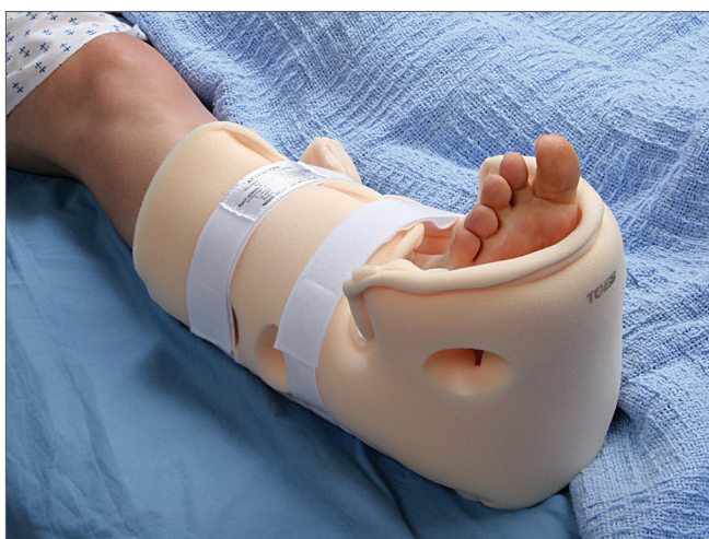
Utgående produkt - Heelift® hälavlastare

Hälavlastare Heelift® utgår ur sortimentet och ersätts av Hälavlastare Body Armor