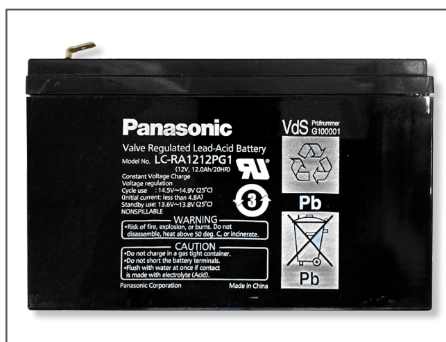
Utgående batteri till Lille Viking Batteriet utgår eftersom modellen har slutat tillverkas.