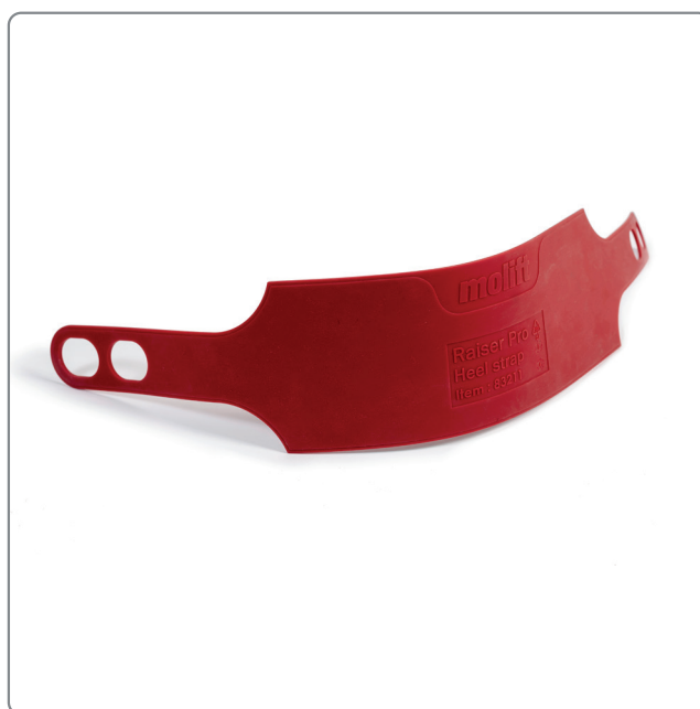
Hälband Molift Raiser Pro