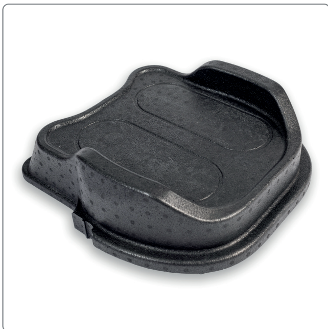
Ståplatta Molift Raiser Pro

Hälbandet är ett tillbehör som används när brukaren behöver stöd för att hålla fötterna i rätt läge. Produkten monteras på Molift Raiser Pros vred och kan justeras i 3 olika längder. HeelStrap ska ge stöd för brukarens hälar vid stående på bottenplattan.