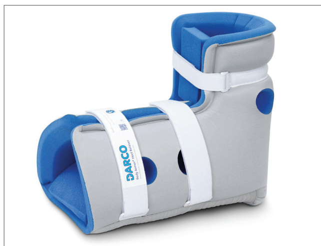
Ny produkt - Hälavlastare Body Armor