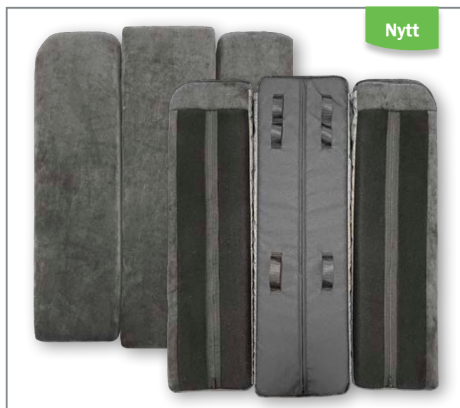
Ryggdyna Prio 3D nytt utförande

Den befintliga ryggdynan utgår och ersätts av den nya.