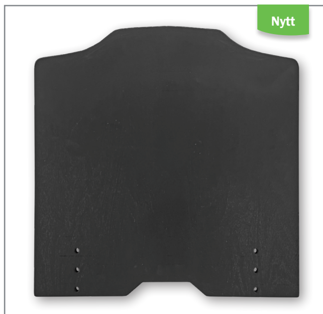
Ny undre sitsplatta Sitsplatta med ny utformning för att passa Prio 3A.