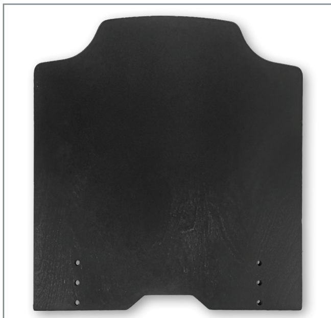
Utgående undre sitsplatta Befintlig sitsplatta utgår.

Sitsplatta undre får en ny utformning för att passa kommande Prio 3A.