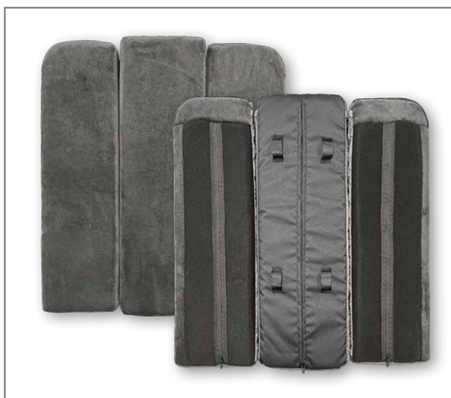
Ryggdyna Prio 3D utgående

För anpassa 3D-dynan till kommande Prio 3A ökar vi höjden på den med 25 mm för att täcka fler rygghöjder. Vi lägger även till en extra hålla högst upp på baksidan av mittdynan och den nedersta hållan blir större för att utöka alternativen av fastsättning.