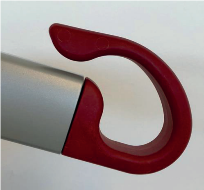
Gamla utseendet på kroken

De röda kompositkrokarna byter material till krokar i metallegering. Införs succesivt