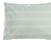
SatinSheet Kussensloop EIM4117S