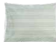
SatinSheet Kussensloop EIM4117S