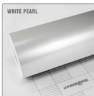
WHITE PEARL CK522