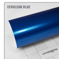
CERULEAN BLUE RB17