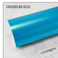
CARIBBEAN BLUE RB09