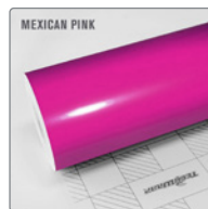
MEXICAN PINK RB21