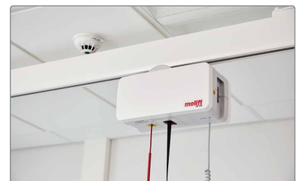
Skinnesystem tilpasset i højden for detektor.