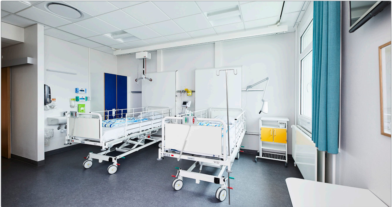
Rumdækkende skinnesystem på 2-sengs stue.

Vi optegner skinneløsninger i Revit og leverer detaljerede beskrivelser, hvor vi også forholder os til entrepriser, der relaterer til loftlift.