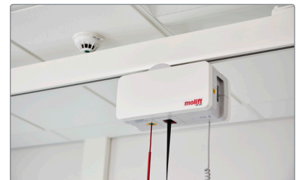
Skinnesystem tilpasset i højden for detektor.