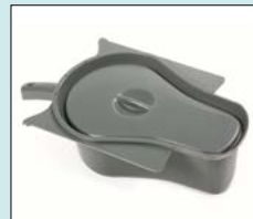
Uppsamlingskäril med lock/nyckelhål