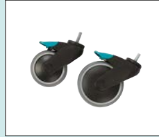
Hjul med broms 100, 125 mm