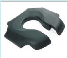
Sits, mjuk till plastsits med hygienurtag, PU, Svart