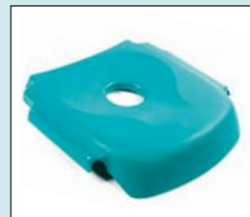
Sits, dusch, plast/grön