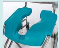
Sits, komfort med öppning bakåt, PU, grön