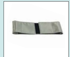
Vadband extra stöd åt underben