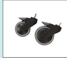
Hjul med riktningsspår 100, 125 mm