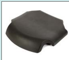
Sits, mjuk, hel till plastsits/komfortsits