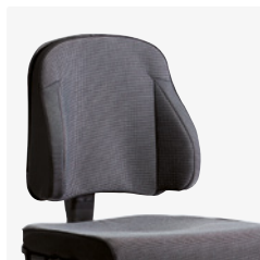
Rücken- und Sitzkissen, anatomisch Rückenkissen: 3195503x-238 Sitzkissen: 3195502x-238