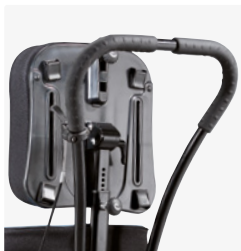
Einstellbarer Schiebebügel, am Sitz montiert 3195148-1, 3195148-3