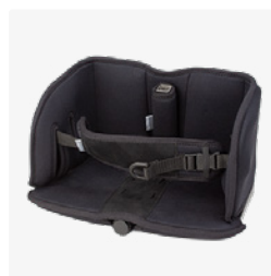
Fußplatte - 3195145-x Polster für Fußplatte - 3195145-xPAD Fußkasten, komplett - 3195145-xBSET