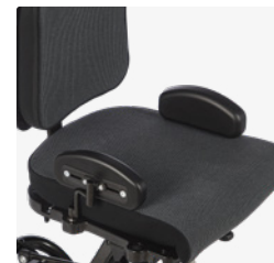
Beckenpelotte seitlich, Paar 3195110-1, 3195111-1