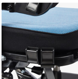
Zusätzliche Klappschnallen 3195710