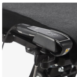
Halterung für Bedienteil 3195540