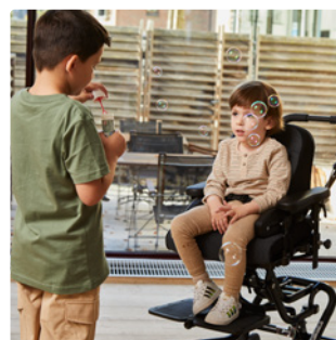
Kleine Details - großer Unterschied