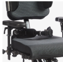
Westen und Gurte Besuchen Sie die Kategorie Zubehör auf der Produktseite