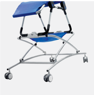
Duschgestell, höhenverstellbar Eine Größe - 31882100