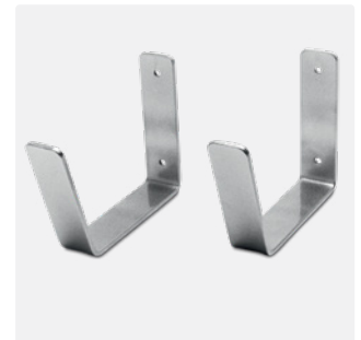
Wandhalterung Eine Größe - 31882110