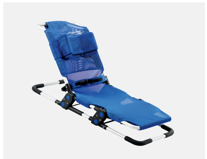
Manatee (gefaltet) für die Nutzung in der Badewanne