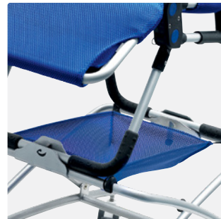
Ablagenetz Eine Größe - 88210x