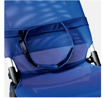
Rumpfgurt Größe 0-2 - 3188302x Größe 3 - 3188307x