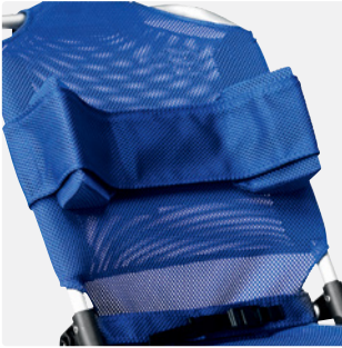
Kopf-/Seitenstütze Größe 0-2 - 3188301x Größe 3 - 3188306x