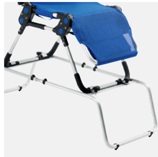
Duschgestell, fest Eine Größe - 31882101