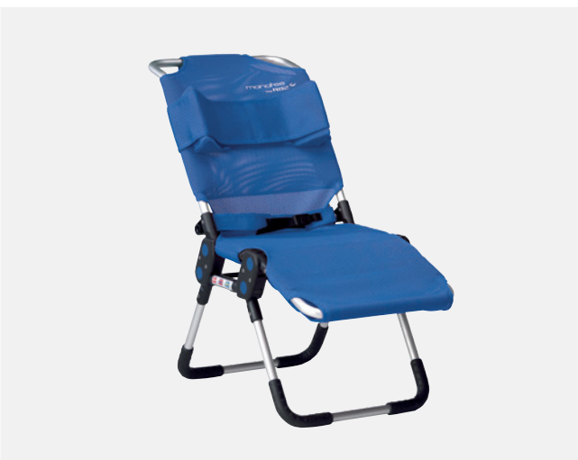
Standard Manatee mit Kopf-/Seitenstütze und verstellbarem Rumpfgurt