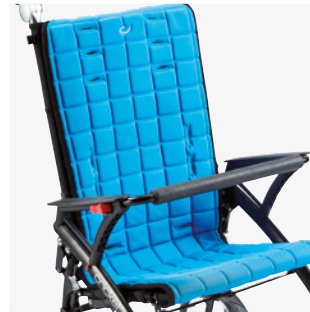
Haltebügel für Armlehnen