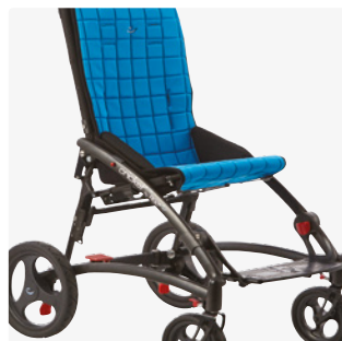
Beckenpelotten zur Sitzbreitenreduktion