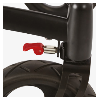
Richtungsfeststeller für die Vorderräder