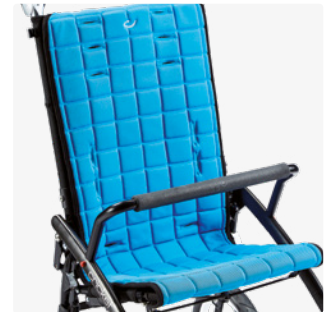
Haltebügel, Montage am Gestell