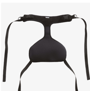
Westen und Gurte