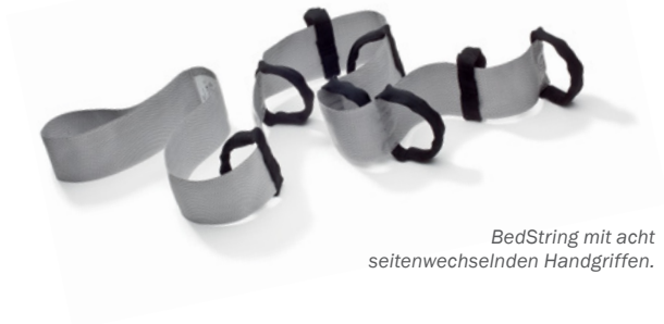
BedString mit acht seitenwechselnden Handgriffen.