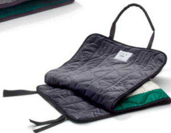
OneWayGlide, lang, mit Handgriffen und Bändern