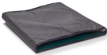
OneWayGlide, Non-Slip, Endlosschlauch

Für kontrolliertes und einfaches Positionieren.