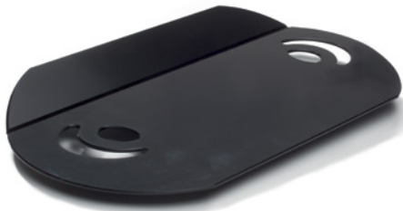
E-Board mit Flügeln

Dünnes und flexibles Transferbrett mit Flügeln.