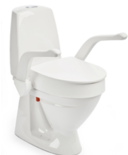
My-Loo mit Armlehnen 100 mm