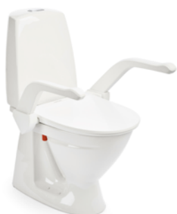
My-Loo mit Armlehnen 20 mm

Die glatten Oberflächen lassen sich leicht mit einem weichen Tuch abwischen und säubern. Sollte eine getrennte Reinigung erforderlich sein, lassen sich Sitz und Armlehnen leicht aus ihren Halterungen entfernen und ebenso einfach wieder einsetzen, ohne die Toilettensitzerhöhung zu deinstallieren.