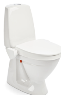
My-Loo 60 mm