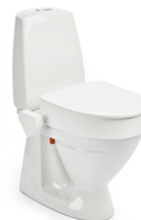
My-Loo 100 mm