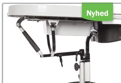
Bord med Quick Release.