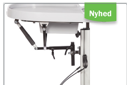
Bord med Quick Release.