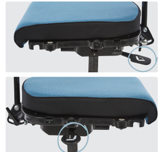
Høyde- og tilt justeringshendel under sete