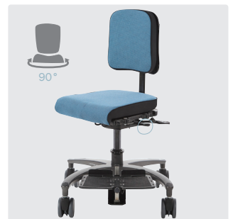
Tilgjengelig med 90° rotasjon. Hendel under setet