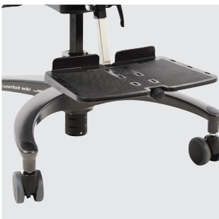
Montert under sete