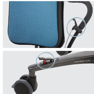
Høydepedal med låsefunksjon på rammen, tilhøvel på skyvebøylen