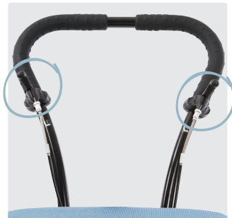
Høyde- og tilthøvel på kjørehåndtak