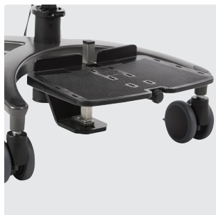
Montert på rammen (Anbefalt hvis svingefunksjon er valgt)