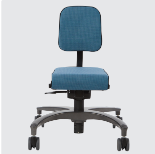
Tilgjengelig i størrelse 1, 2 og 3