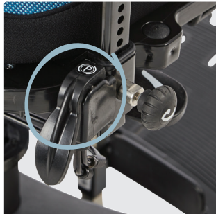
100 mm svinghjul. Tilgjengelig med sentralbrems