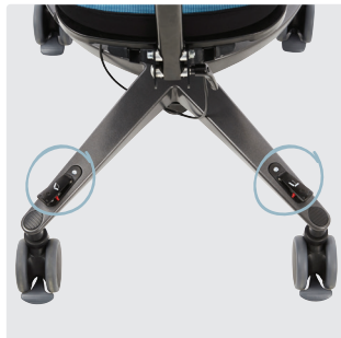
Høyde- og tiltpedaler med låsefunksjon på rammen