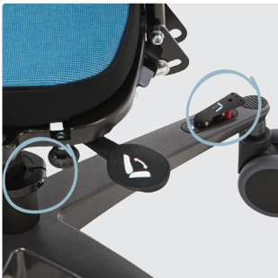
Høydepedal med låsefunksjon på rammen, tilhøvel under setet