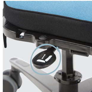
Høydejusteringshendel under sete, ingen tilt