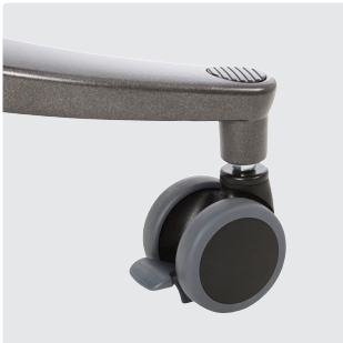
75 mm eller 100 mm svinghjul. Bremses på alle 4 svinghjul