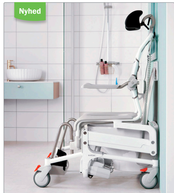
Alto med Opret hovedstøtte og Opret ryg over væghængt toilet.