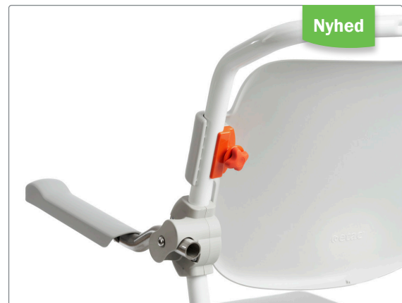
Fast ryg aftørbar, med fingerskrue for nem montering uden værktøj.