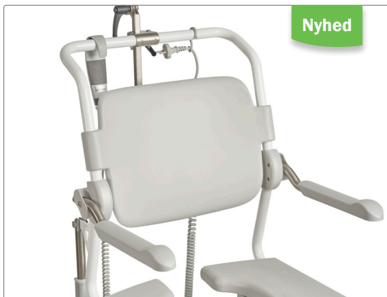
Fast ryg, aftørbar.

Vær opmærksom på, at denne ryg ikke passer på XL-modeller.