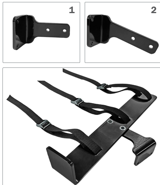
Det lige fæste/beslag (1) passer til Cross 5, Cross 5XL og Transit. Det vinklede fæste/beslag (2) passer til Cross 6.