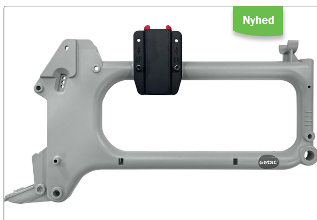
Lys grå (Farve-78).

Blandt ændringerne nævnt på foregående side er bl.a. farveskiftet fra Mørk grå (farve-58) til Lys grå (Farve-78).